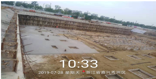
图2 现场已开挖至坑底照片

(2)本工程采用φ400@1800的锚桩,由于锚桩间距较小,可能存在较大的群锚效应。本工程每道锚桩采用长短相间的布置形式,长锚索在原有计算的基础上增加2m,锚头不在同一平面上,拉大锚头的间距,从而减小群锚效应。