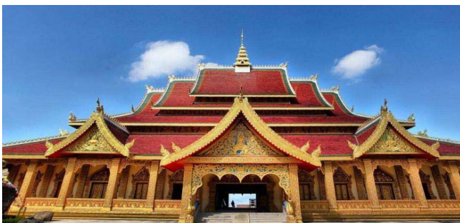
图4 西双版纳佛教建筑

屋顶为南传佛教最突出特色,轮廓变化丰富、大而陡,采用分段举折重叠递升的歇山式屋顶,曲线优美、装饰华丽、色彩绚丽(见图4)。西双版纳佛教建筑结合各地佛教建筑与当地传统建筑的优点,形成落地式和干栏式两种建筑类型,落地式包含临沧型、瑞丽型和版纳型。而德州瑞丽地区名为“樊房”的建筑类型则是干栏式 [2] 。