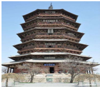
图2 山西佛光寺释迦塔