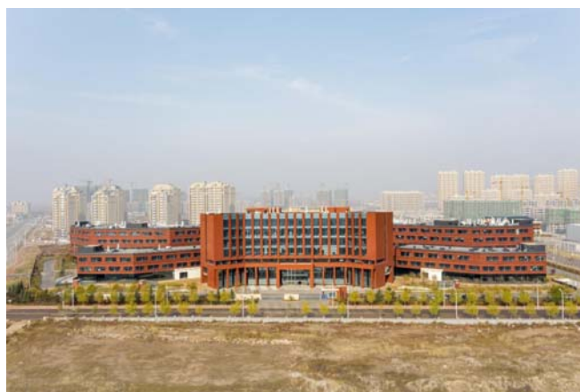
图1 项目正面实拍照片

物品流向、实验环境、温湿度、洁净度、抗震动、电气屏蔽、消声等都有特殊的技术要求。